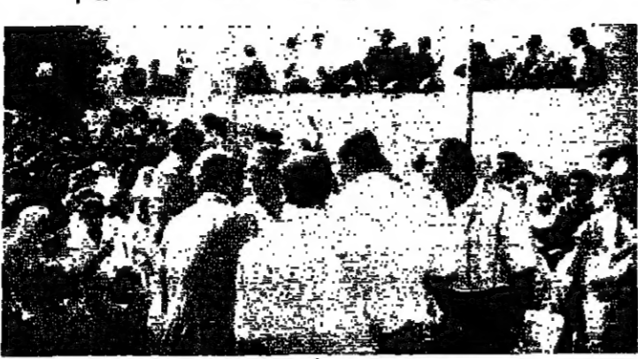
الصحور في مهرجان البرج الشمالي

صيدا - الانوار: بمناسبة اسبوع ابو سمير وهي احد ضحايا انفجار السيارات المتفجعة في صور لقيم مهرجان خطابي حشد في حسيبية بلدة البرج الشمالي كقضاء صور حضوره المفتي الجعفري لمتنان الشيخ عبد الامير قبلان والقاضي الجعفري صيدا السيد محمد حسين الامين وعضو المكتب السياسي لحركة امل الحاج خليل حمدان وعدد من قادة الحركة وشخصيات رسمية وشعبية وقلبية وفاعليات. وتخلل المهرجان اي من الذكر الحكيم تلامة الشيخ حسن حلقون، ثم خطب في حزام الشيخ زيد فحمن وقدم الخطباء محمود عيسى والقي كلمة ال الفقيد السيد شريف وهي: ثم تحدث المفتي الجعفري لمتنان الشيخ عبد الامير قبلان داعيا الى دخول الجيش اللبناني الى اقليم التفاح ومسح السطحين والقتال ليلتان من الضياع قبل قوات الانوار. كما تحدث القاضي الامين والحاج خليل حمدان، فكلما على ضرورة الحفاظ على الجنوب اللبناني امام الهجمات التي يتعرض لها والنمسه بفرار